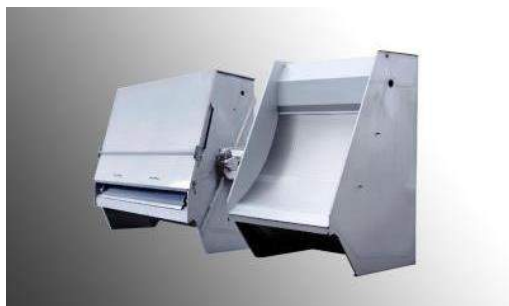
STATIC SCREEN avec ou sans capotages